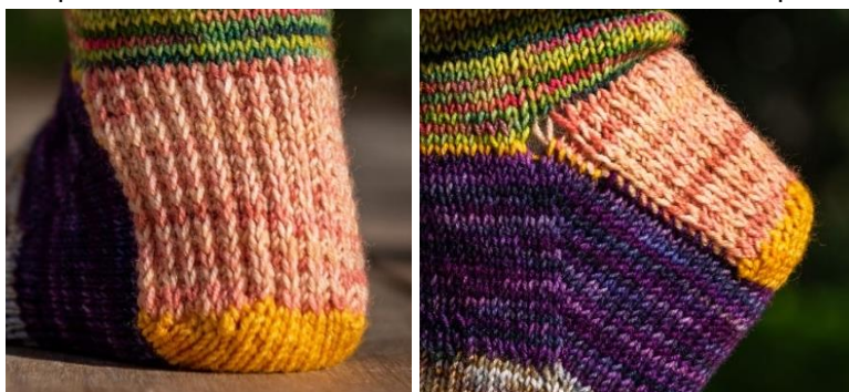
Figure 1 : Arrière du Talon

Répartir pour avoir 25 ; 28 ; 29 ( 31 ; 33 ; 35 ; 37 )m sur chaque aig.